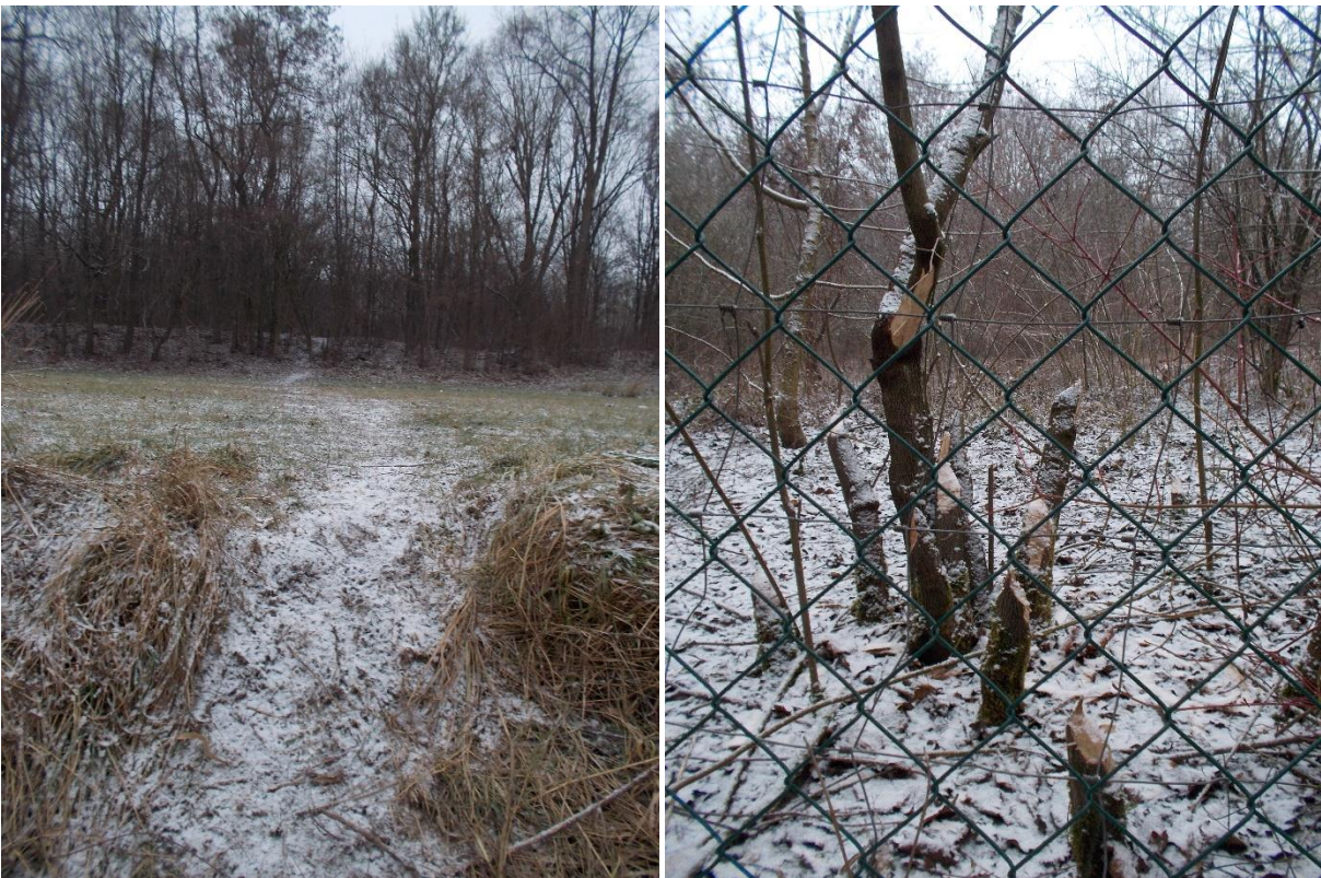
Sowohl Dachs ( Meles meles , s.o.) als auch Biber ( Castor fiber ) nutzen sowohl den Bahnhofswald als auch die Flutmulde, wie die regelmäßige Beobachtung von Biberrutschen vom Pfettrachufer aus in den Bahnhofswald zeigen (links) als auch die teils recht ungewöhnlichen Gehölzvorlieben (Kornelkirschen des Bahnhofswaldes, rechts, beide Aufnahmen 16.12.2018)