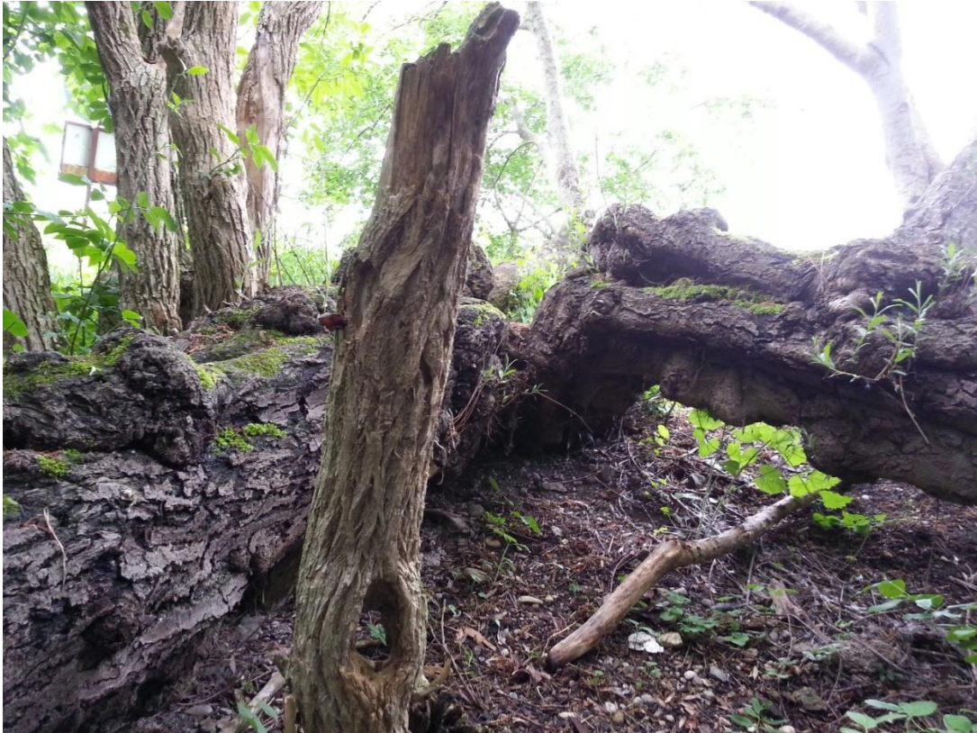
Ein besonderer Wert des Bahnhofswaldes liegt darin, dass sich Bäume bis zu ihrem natürlichen Zerfall entwickeln können, noch dazu in sehr großer Artenvielfalt, wie hier bei dieser mehrstämmigen Lavendelweide ( Salix eleagnos ), Aufnahme: 18.4.2014, mittlerweile durch Überbau mit Garagen vernichteter „West-Ausläufer“ des Bahnhofswaldes)