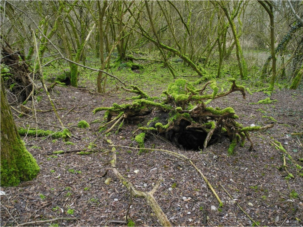
Wurzelteller entwurzelter Bäume im Zentrum des Bahnhofswaldes mit Eingang eines Säugetierbaus (Aufnahme 15.3.2015)