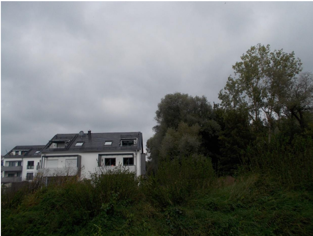
Ein Beispiel für die zu dicht an den wertvollen westlichen Waldrand gerückte Bebauung, an die sich in dem „Pufferstreifen“ Carports anschließen – so sind Konflikte zwischen Naturschutz, Waldschutz und Verkehrssicherung vorprogrammiert (Aufnahme: 30.9.2020)