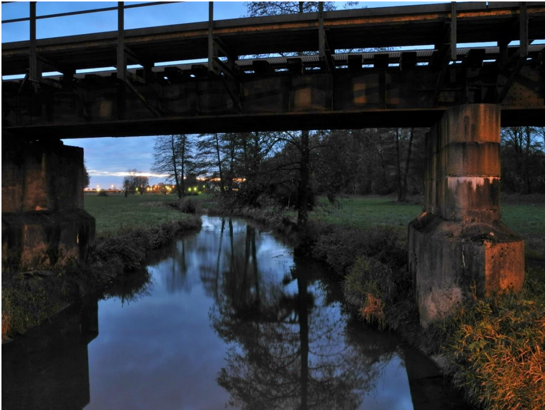
Bahnbrücke über Flutmulde und Pfettrach, im Hintergrund rechts der Bahnhofswald – die Flutmulde bildet eine Vernetzungsachse sowohl ins Hügelland als auch zur Isar (als wasserführender „dritter Isar-Arm“ bei Hochwasser, Aufnahme: 2.11.2013)