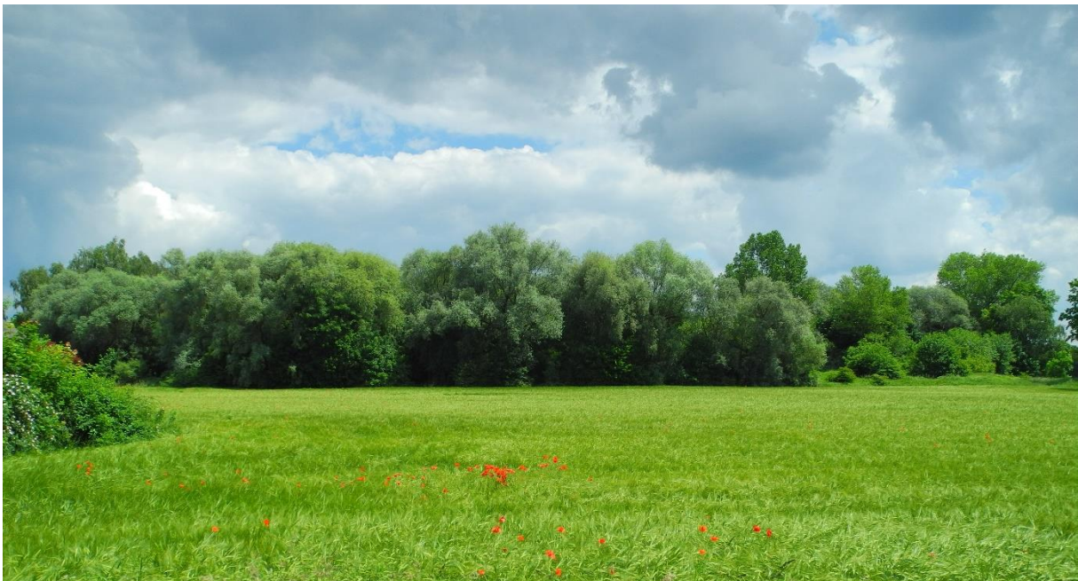
Bild 2: Landshuter Bahnhofswald von Westen vor Einsetzen der Bebauung des angrenzenden Ackers (Aufnahme: 1. Juni 2014, zu sehen ist der silberweidenreiche Westrand und das „Südwest-Eck“ (rechts i. Bild) mit ausgeprägter Waldrand- und Saumstruktur, im Hintergrund ragen Schwarzpappeln und am rechten Bildrand eine Hybridpappel aus dem Waldbestand, die auf der Oberkante zur Flutmuldenböschung stockt)

Die Stadt Landshut beabsichtigt, das Areal als Schutzgebiet (LSG, LB oder Naturdenkmal) zu sichern. Gleichzeitig ist es in den letzten Jahren an den Rändern zum Heranrücken der Bebauung und auch zu Flächenverlusten (Verlust von 0,17 ha im Nordwestbereich entlang der Gleise für Bebauung) und dadurch zu zunehmenden Beeinträchtigungen gekommen. Auch als Grundlage für die Frage, welche weiteren Verluste dem Areal in Bezug auf seine Bedeutung und Funktionen naturschutzfachlich zumutbar sind, sollen die hier zusammengestellten Artbeobachtungen dienen.