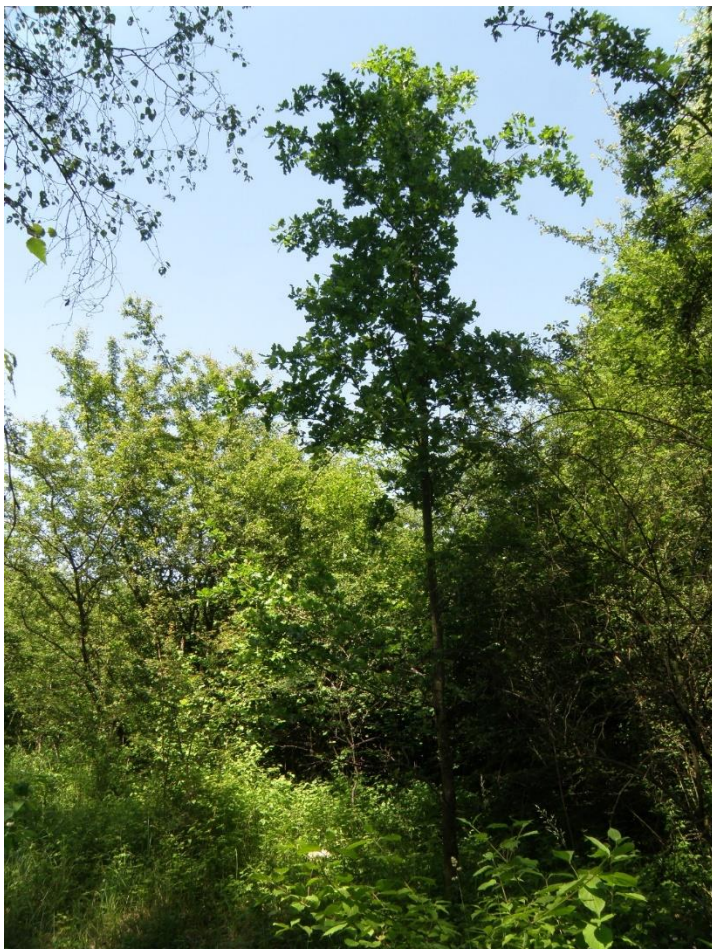
Die zahlreichen unterschiedlich alten Stieleichen ( Quercus robur ) des Gebiets aus Hähersaat bevorzugen deutlich die Waldränder und -säume (Aufnahme 9.6.2014)