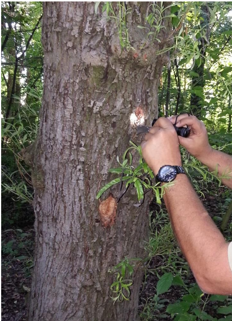
Tote Waldspitzmaus ( Sorex araneus ) auf dem Pfad (Aufnahme: 6.10.2013, links oben) und kleine Baumhöhle mit Fledermauskot vom Langohr-Typus ( Plecotus spec. ) in Lavendelweide ( Salix eleagnos ) nahe dem westlichen Waldrand des Bahnhofswaldes (Aufnahme: 10.6.2017, rechts oben und unten)