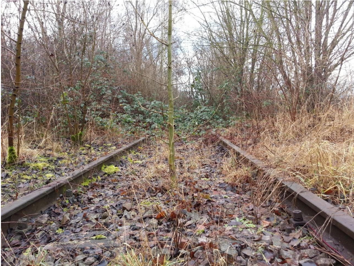
Nicht mehr in Betrieb befindliche Gleise, die der Gehölzsukzession unterliegen (Aufnahme: 6.10.2014)