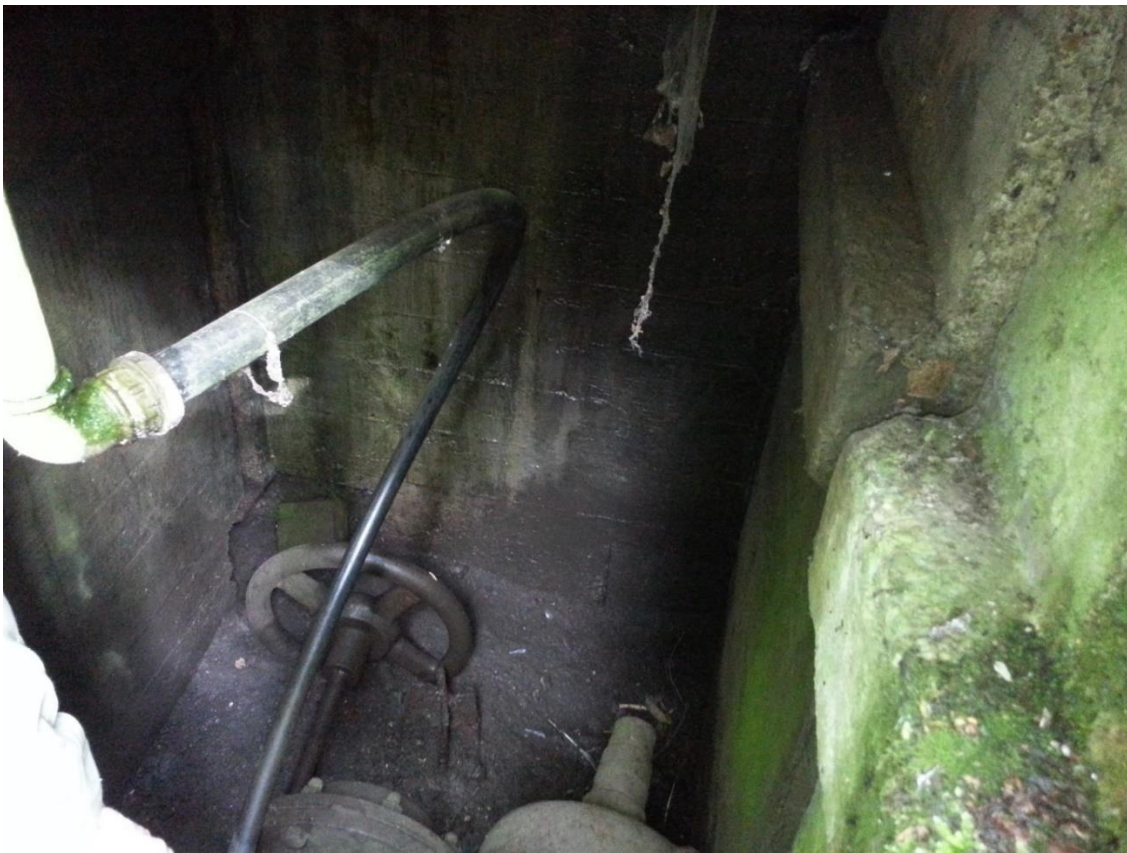
Unterirdischer Revisionsschacht unter den Gleisen als potenzielles Winterquartier für Fledermäuse oder Steinmarder-Versteckplatz (Aufnahme: 18.5.2014)