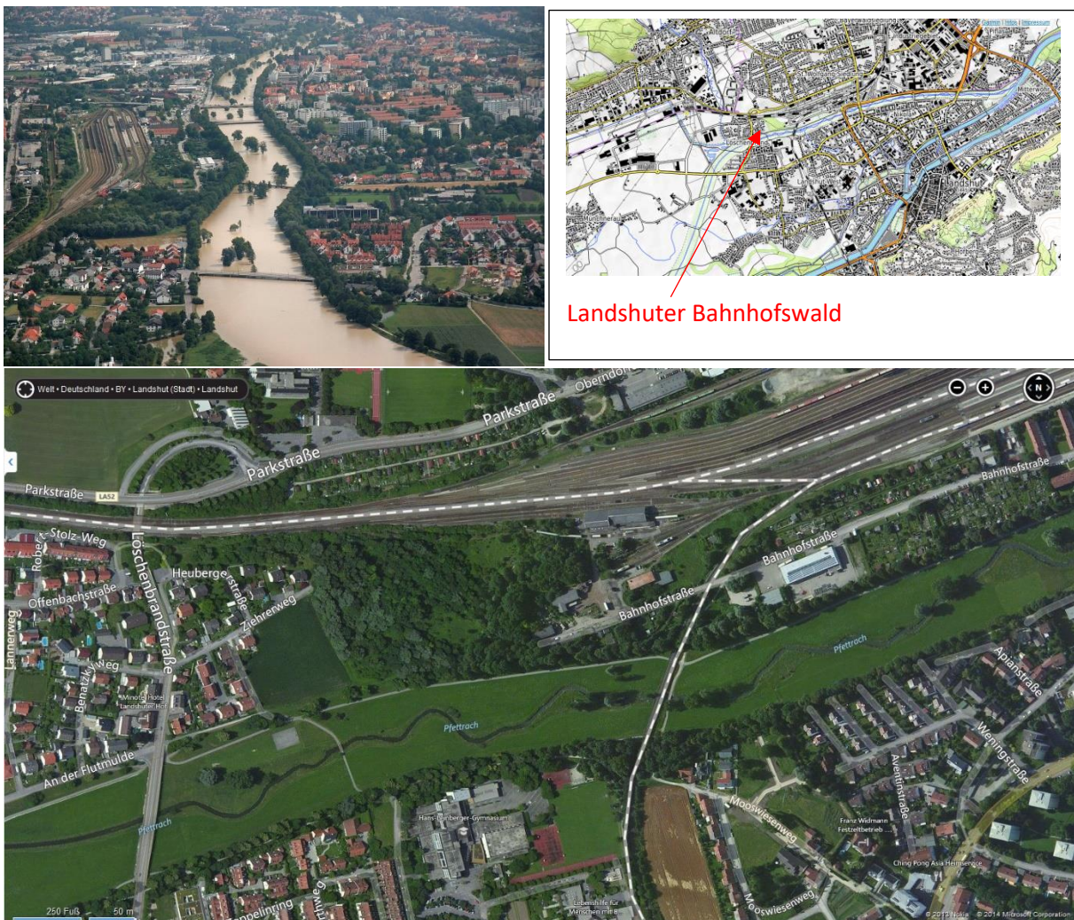
Bild 1a (oben links): Landshuter Bahnhofswald während des Hochwassers (Aufnahme 25.8.2005,)

Der Bahnhofswald Landshut ist ein sehr vielfältiges, mit mehreren trockenen und feuchten Lichtungen durchsetztes, bei etwa 4,8 Hektar reiner Waldbestandsfläche einschließlich der Lichtungen 4,97 Hektar großes Areal westlich des Landshuter Hauptbahnhofs. Aufgrund seiner vielfältigen Standortbedingungen , die Substrate von Kies, Sand, Schluff, Ton, Basaltsteinen, sauren Magersubstraten (im Isartal sonst sehr selten bis fehlend) und Mehrschichtböden, anthropogene Höhlen und Blockhaufen, sowie neben feuchten auch sehr trockene, flachgründige enthalten, bietet er sehr vielfältige Ausgangsbedingungen für artenreiche Lebensgemeinschaften. Hinzu kommt seine Lage zwischen zwei Haupt-Biotopverbundachsen . Die eine Verbundachse wird als „ feuchte Achse “ (bzw. Achsen) mit der Pfettrach gebildet, die aus dem Tertiärhügelland kommend in der Flutmulde unmittelbar am Bahnhofswald vorbei fließt, und bei Isarhochwässern das Isarhochwasser aufnimmt und damit einen dritten Isar-Arm neben Kleiner und Großer Isar bildet. Die zweite Verbundachse wirkt als „ trockene Achse “ über die Bahngleise mit ihren xerothermen Begleitstrukturen lückiger Bahnkörper und -böschungen. Zwischen feuchter und trockener Achse liegt der Bahnhofswald in unmittelbarer, mittlerer Lage zwischen beiden Strukturen, und stellt somit eine „ Artendrehscheibe “ dar (s. Bild 1).