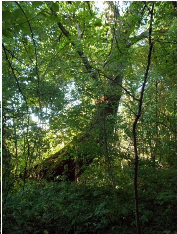
Zwei Pappelarten mit unterschiedlicher Lebenserwartung: Umgestürzte Aspe ( Populus tremula , linke Aufnahme 10.5.15) und eine aus Zeiten von vor der Bombardierung des Bahnhofs stammende, sehr vitale Schwarzpappel ( Populus nigra , rechte Aufnahme 10.7.15)