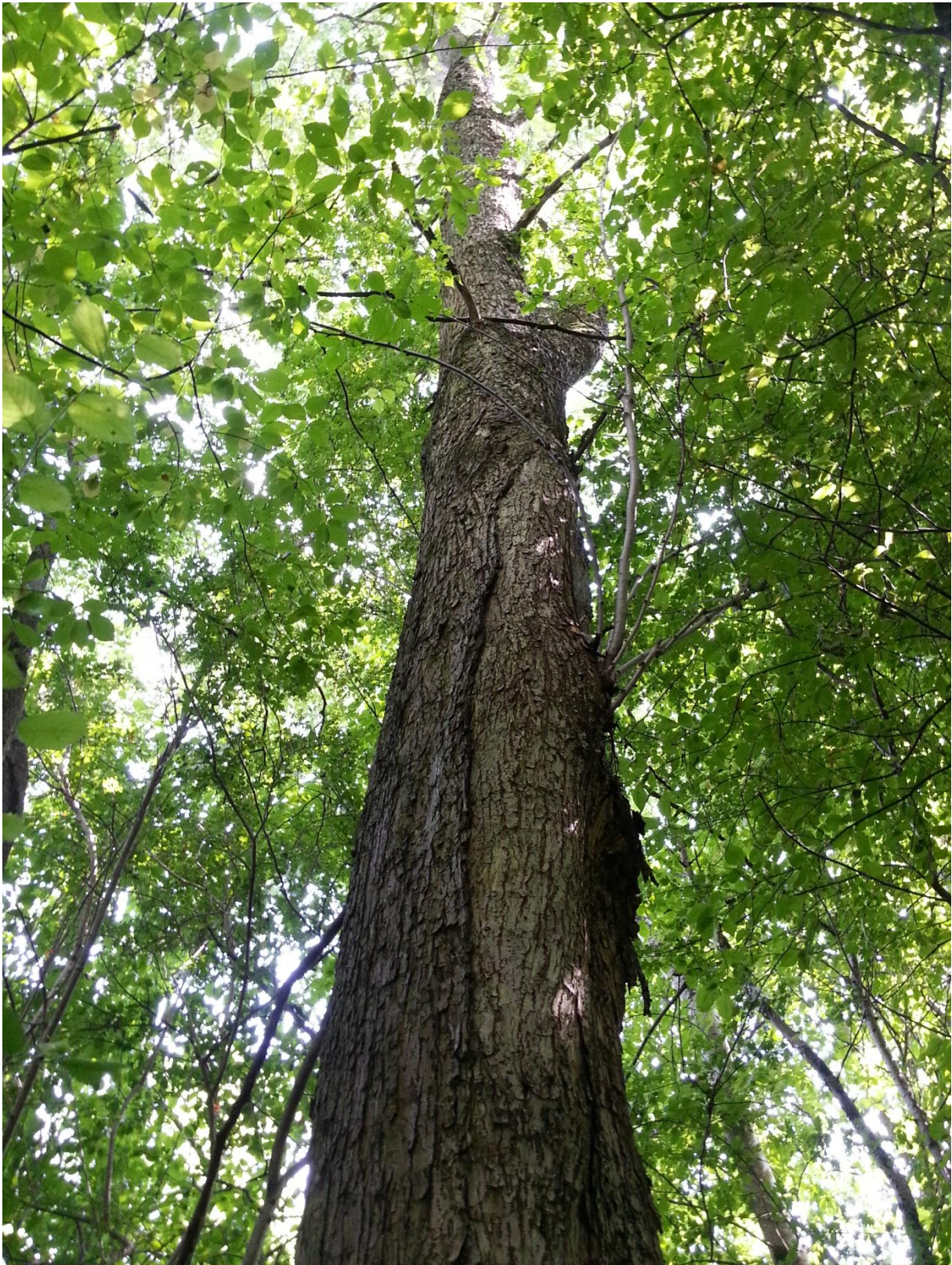
Eine der alten Flatterulmen ( Ulmus laevis ) im Zentralteil des Bahnhofswaldes mit Spalten- und Rindenquartieren als potenziellem Quartier für Fledermäuse und Versteckplatz für diverse Insekten aus dem Bahnhofswald und der angrenzenden Flutmulde (Aufnahme: 23.7.2013)