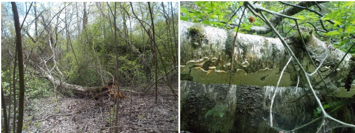
Alte Baumsturzlichtung mit Moorbirke ( Betula pubescens ) (Aufnahme: im frisch geworfenen Zustand links 18.4.2015 und zwei Jahre später rechts 10.6.2017)