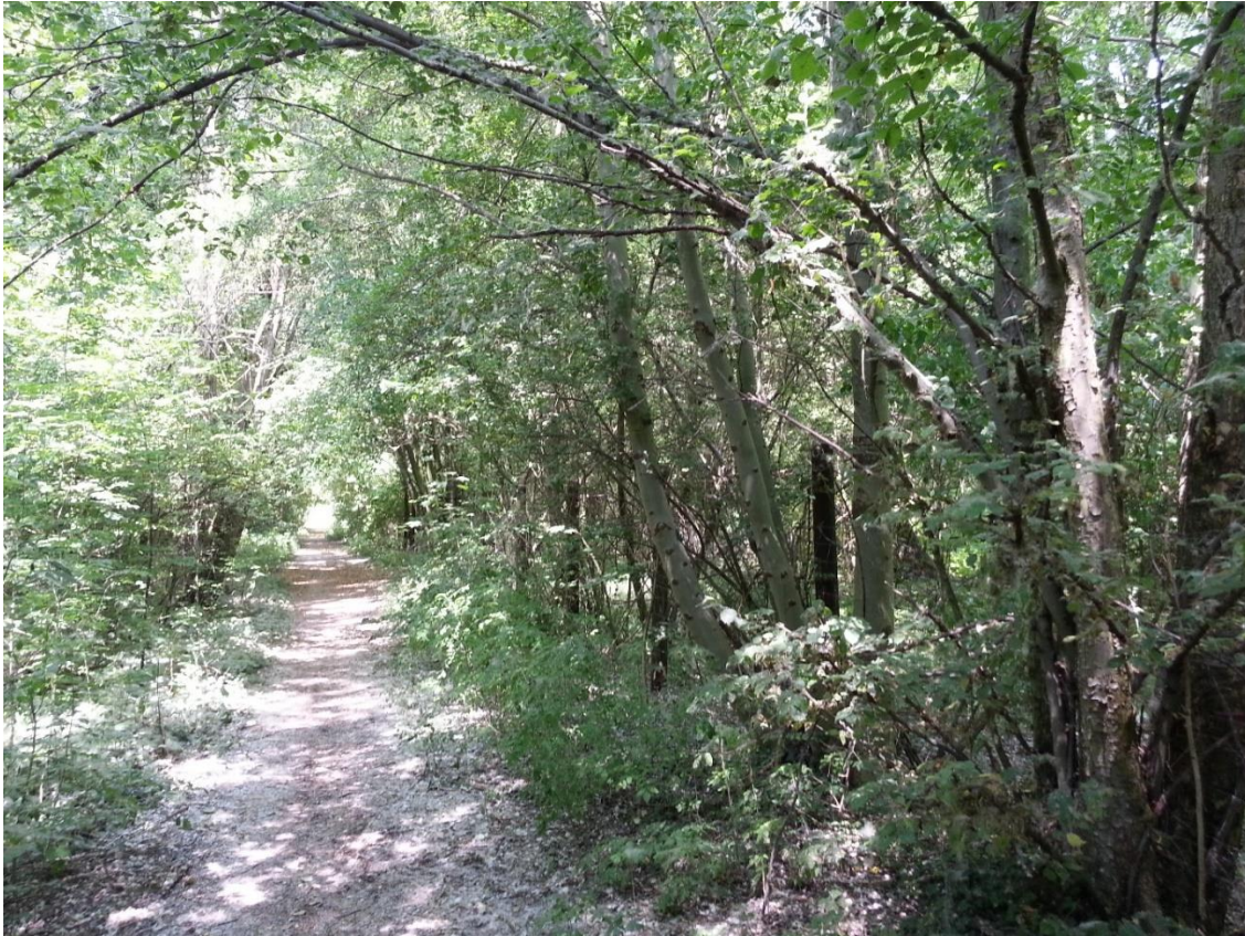
Mit Weidenflaum übersäter Haupt-Pfad entlang des Zaunes auf der Höhe des Silberweiden-Auwaldes, im rechten Bildbereich die Flatterulme mit Nachweis des Ulmen-Zipfelfalters (Aufnahme: 23.7.2013)