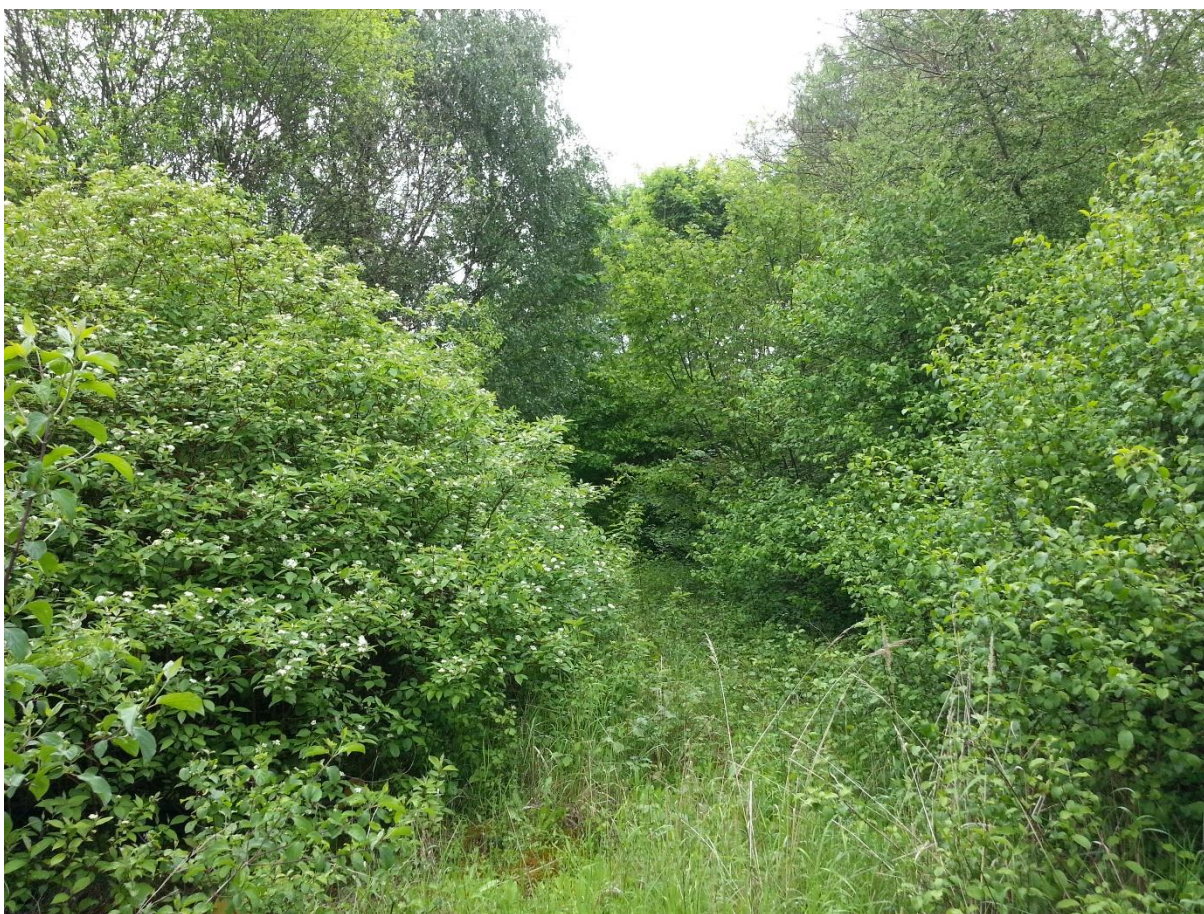
Ausgeprägte Ökotope zeichnen den Bahnhofswald aus, hier der innere Waldrand zu einem mittlerweile mit Garagen überbauten Pfad (Aufnahme: 18.5.2014)